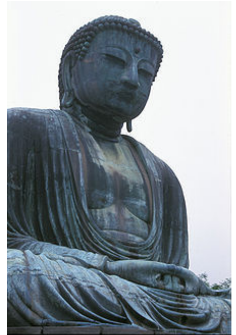
A grande estátua do Buda Amitaba, em Kamakura, Japão.

Mais detalhes sobre o uso do número 108 podem ser encontrados em um artigo de Charles C. Goodin [2].