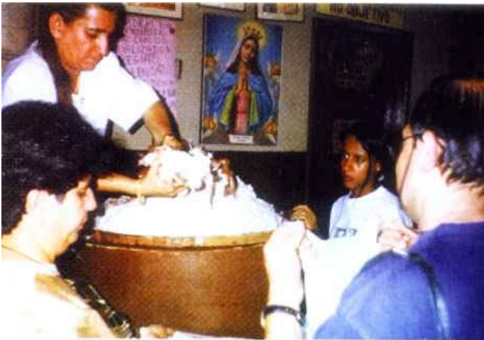
Ederlarzil em Atividade

Os objetos materializados sugerem que algum trabalho de magia teria sido feito por alguém para esse autor. Segundo se conta, em certos casos, o nome da pessoa que fez o trabalho de magia aparece escrito junto com os objetos.