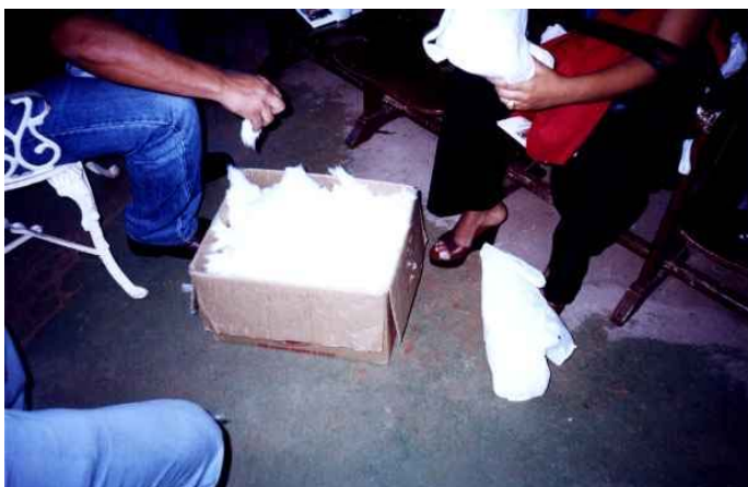
Preparo do Algodão

Ao lado do tanque, o algodão é retirado das caixas e colocado em várias peneiras, formando grandes montes. As peneiras cheias de algodão são empilhadas umas sobre as outras, junto à parede do fundo. Percebe-se, por isso, e, pela forma que são manipuladas, que são bem leves (veja a foto abaixo).