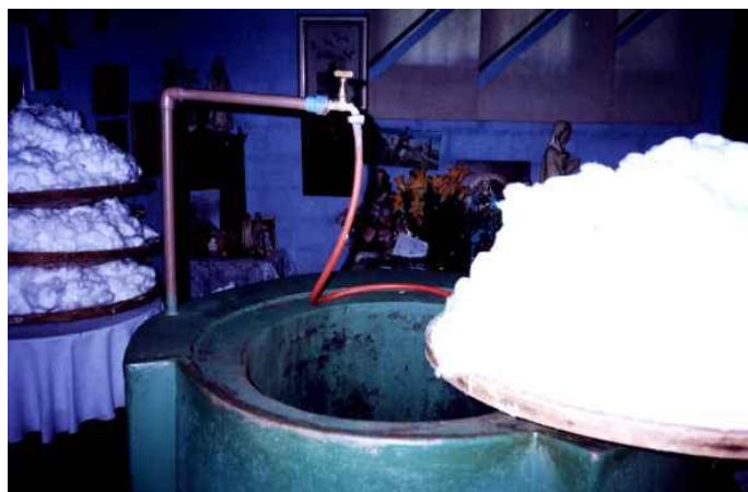
Detalhe do Tanque

Ao entrar no salão, as pessoas ocupam as quatro primeiras fileiras de cadeiras. A primeira delas fica a 1,5 metro do tanque. Nesse momento, as peneiras ainda estão sendo preenchidas com algodão. A primeira peneira é posta então sobre a pia e encharcada com água e um pouco de álcool pelo assistente.