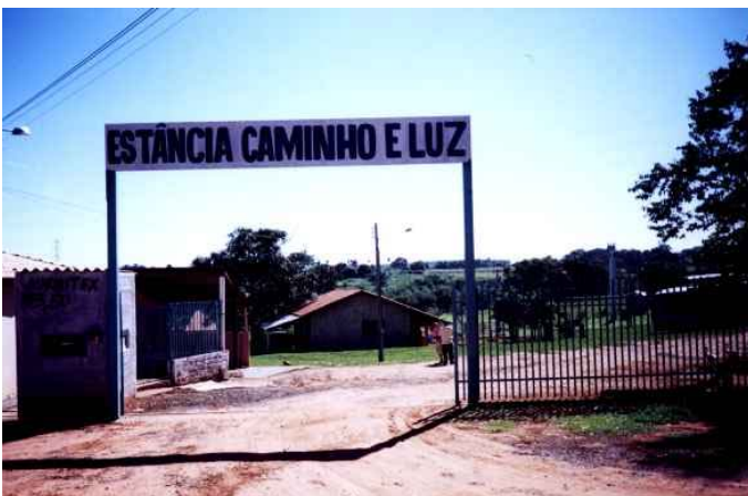
Entrada da Chácara

Segundo Ederlarzil, poderíamos até fotografar a nossa sessão de materialização mas não as de outras pessoas que podiam se sentir incomodadas com isso.