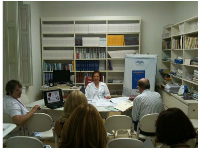
Lançamento do livro em Porto Alegre

Macrossoma vem das palavras do idioma Grego, makrós , “comprido; longo; grande” e soma , “relativo ao corpo; o corpo humano em oposição. O termo, empregado na Conscienciologia, não deve ser confundido com significado dado pela medicina, que seria simplesmente uma pessoa com o corpo muito grande.